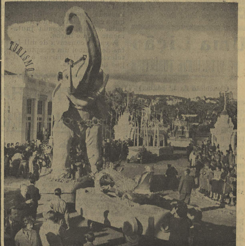
O magestoso e artistico «Carro-Elefante» desfilando no curso desse espectáculo maravilhoso que foi o Carnaval do Estoril

Aproveitando a sua visita a esta provincia, Sua Excelência visitará pelas 10 horas do mesmo dia o Posto Agrário de Tavira.