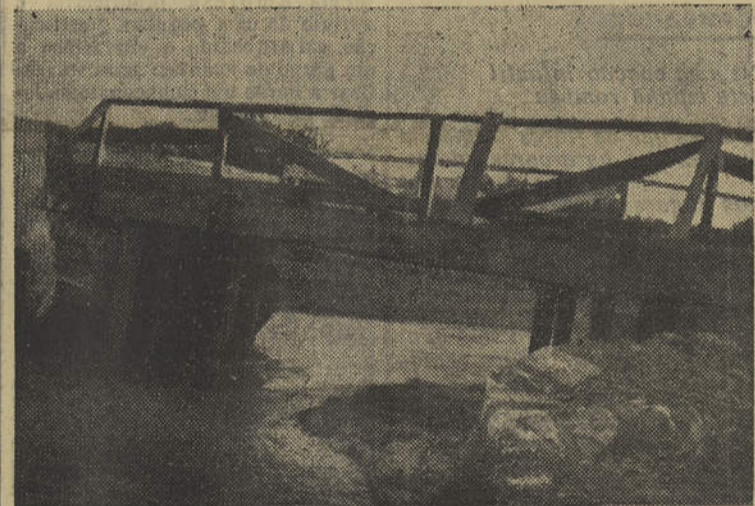
Esta é uma imagem da ponte sobre a ribeira do Almagem, depois do último temporal, que destruiu um dos arcos da velha ponte romana. E' com este improvisado de tábuas e duas traves de ferro que se pretende aguentar o trânsito de centenas de veículos, que por ali transitam diariamente.

recônditos lugares de um país. São de tal importância as estradas, que os romanos, um dos grandes, se não o maior, dos povos civilizadores da antiguidade, tinham como primordial problema na civilização de um país, o