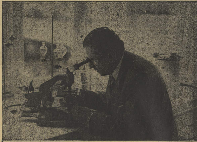
O AUTOR DA ESTABILIZAÇÃO DA GELEIA REAL PROF. BOYER DE BELVEFER

Todavia, muitos indivíduos, quer seja em consequência de perturbações digestivas quer por deficiência geral, necessitam de alimentos predigeridos e, por conseguinte, solicitam um esforço mínimo por parte das glândulas gástricas e intestinais. O fisiologista, a fim de facilitar ao homem as funções digestivas e o trabalho de assi- (Conclui na 4.ª página)