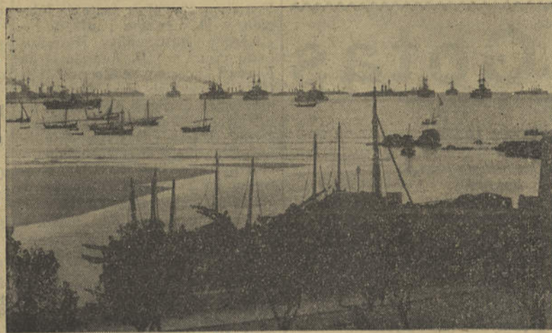
Uma esquadra inglesa fundeada na baía de Lagos

Foi em 1905 que essas aparatosas cortezias que se revestiram de extraordinário esplendor e decoraram num ambiente de extrema cordealidade e gentil delicadeza entre os almirantes das três esquadras britânicas reunidas e El-Rei D. Carlos I presente na baía