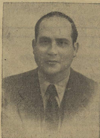
Comandante HENRIQUE TENREIRO

Não poderíamos deixar passar este momento, sem agradecer a duas altas individualidades do nosso País a concretização desta tão grande obra de alto valor social para os nossos pescadores, individualidades que sempre têm olhado para a nossa vila com bastante carinho, ao sr. Ministro das Obras Públicas Eng.º Arantes e Oliveira e ao sr. Comandante Henrique Tenreiro, aqui patenteamos o nosso agradecimento.