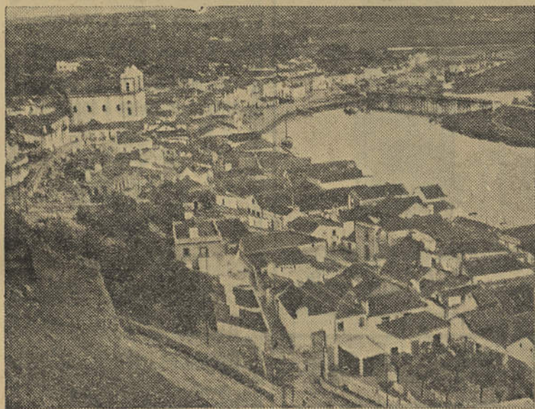
IMAGENS DE PORTUGAL — Vista Parcial de Alcaicer do Sal

O programa definitivo destes festejos será oportunamente anunciado.