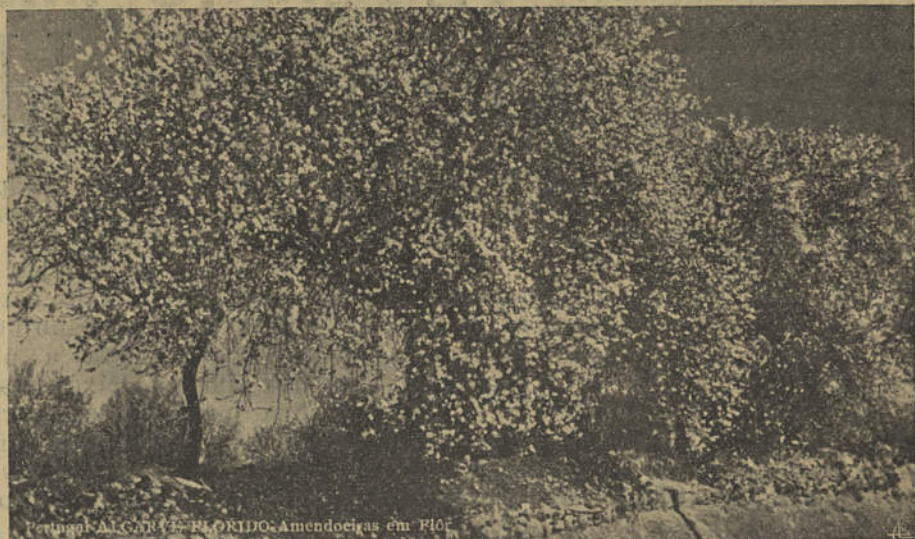
Algarve FLORIDAS Amendoeiras em Flor

Sómente um problema, escurece este céu limpo nas nossas