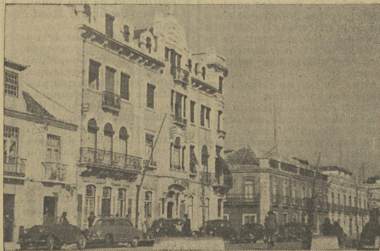
Qual barco abandonado, o HOTEL GUADIANA, navega sujeito ao acaso Notícia na 6.ª coluna