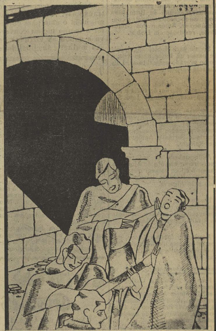
Coimbra do Mondego, das canções, das tradições; e a voz nostálgica do estudante, interpretando as saudades do Hilário, diz-nos que «Coimbra inteira chorou, a guitarra emudeceu, três dias não se cantou...»

Espera-se grande afluência de forasteiros, dada a justificada fama destas festividades.