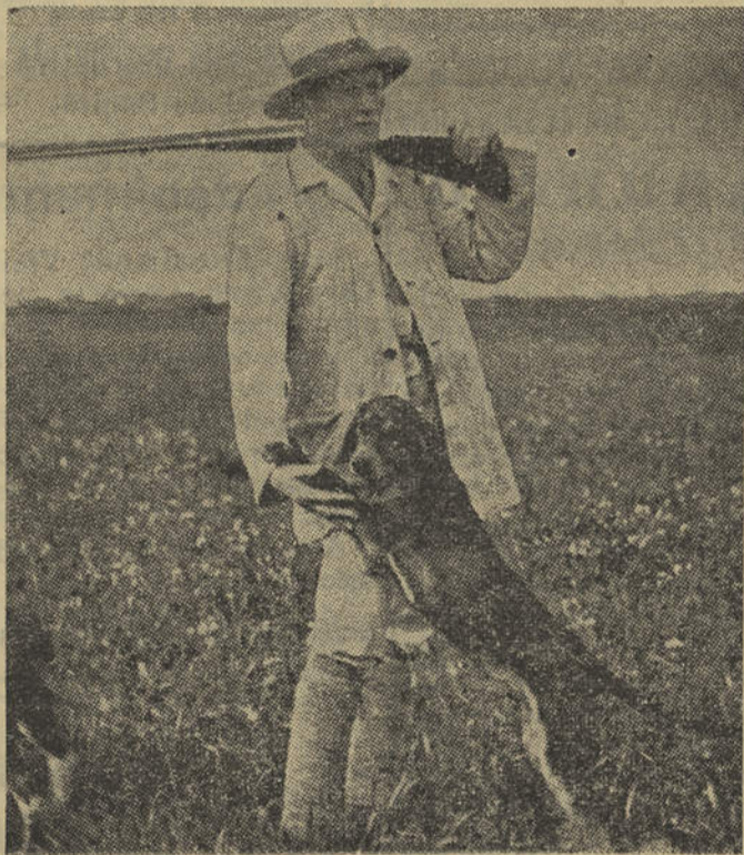
Abriu a caça — e o homem, a planície, a espingarda e o cão, tornam a ser amigos inseparáveis

A noite, no Café, em todas as mesas se fala de caça; os que não são caçadores ouvem as conversas com interesse e com pena de não serem aficionados. Recordam-se proezas das épocas venatórias passadas e no íntimo dos caçadores mais novos, há uma confiante