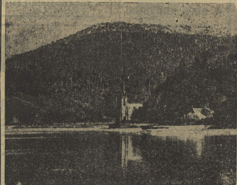
Um aspecto da encantadora Lagoa das Furnas, vendo-se ao fundo a Ermita