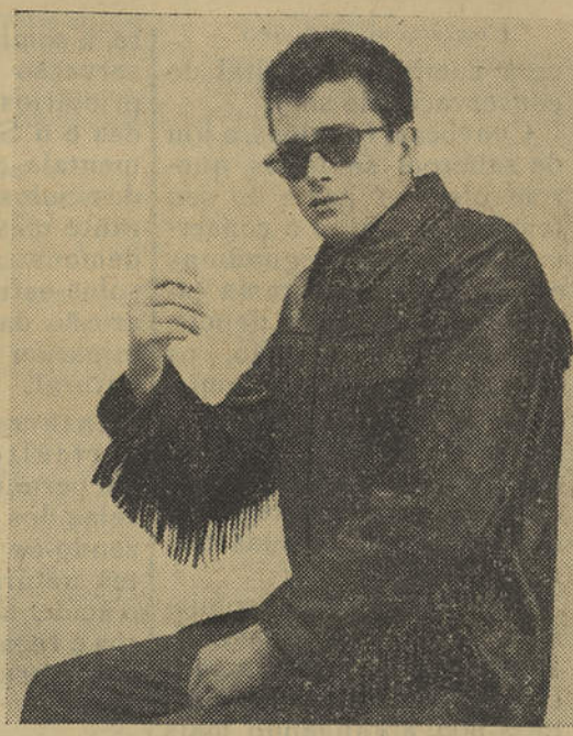
Alguns dos nossos leitores está interessado?...

QUALQUER Dior da moda masculina, lançou no mercado europeu este casaco de franjas, que nos faz lembrar a lendária figura de Robih dos Bosques ou, mais actualizada, a de um «cow-boy» dos que o cinema popularizou. Contudo, trata-se da herança que o mito de James Dean legou à posteridade e, particularmente, a essa turbulenta geração composta de elementos anarquistas, a que filósofos dos nossos dias apelidaram de rebeldes sem causa.