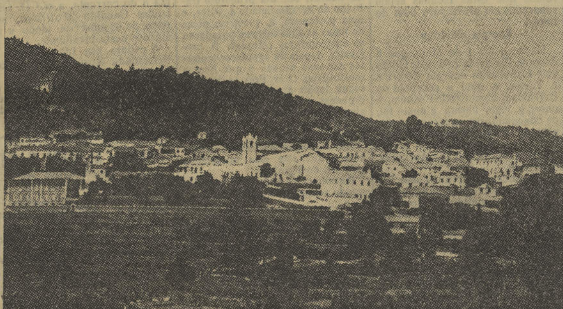
S. BARTOLOMEU DE MESSINES — Terra Natal do Poeta João de Deus