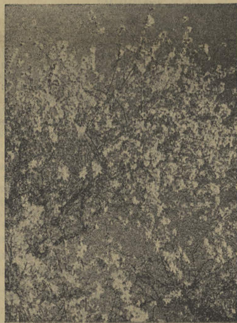
Um lindo aspecto do «noivado algarvio»

Agosto num clima mediterrâneo? As vestes do povo, os costumes... Até um caminho de poesia por entre amendoiras indiscretas, escuta o passar dum carrito puxado por um muar. Há festa em Tavira. Fala-se já na Feira desta e daquela terra. E na aldeia mais longinqua da brisa atlântica, canta-se, há procissões e o domingo veste-se mais elegante.