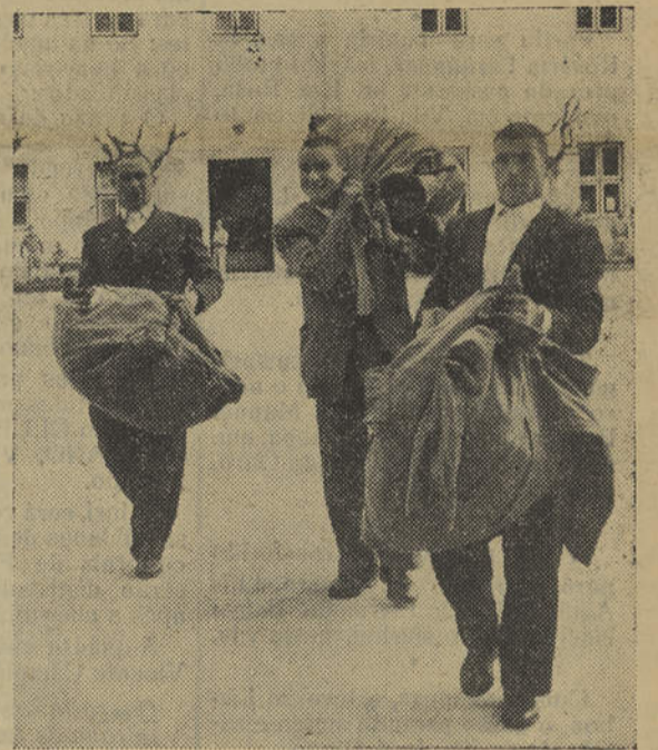
Hoje, apenas rapazes; amanhã, soldados de Portugal!

FOI ali, ao pé da velha estação do Rossio, que os tornei a ver. E senti saudades desses já passados seis anos quando fui chamado a cumprir o serviço militar. E tudo isto, porque meus olhos habituados ao espectáculo que se repete anualmente e minha alma, tocada levemente por um frémito estranho, fizeram-me lembrar esse mesmo quadro que nenhum pintor usou pintar.