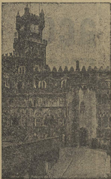
Palácio da Pena — SINTRA

O «Noticias do Algarve» vende-se em Olhão, na Livraria Capela, Rua do Comércio.