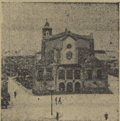
O local assinalado pela cruz é onde estão instalados os serviços da Junta de Freguesia de Olhão

Como é do conhecimento geral, a freguesia de Nossa Senhora do Rosário de Olhão, única do concelho, com sede naquela vila, estende-se presentemente; na direcção norte-sul, desde o mar até à Estrada Nacional; na direcção este-oeste desde o chamado Caneiro do Brejo,