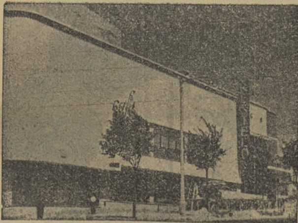
Cinema Restolo — LISBOA

90 % das construções em Portugal são impermeabilizadas com o nosso sistema de camadas multiplas de