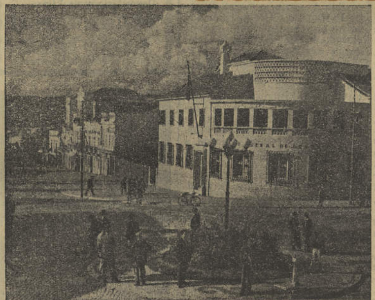
LOULÉ — A vila de grandes tradições carnavalescas