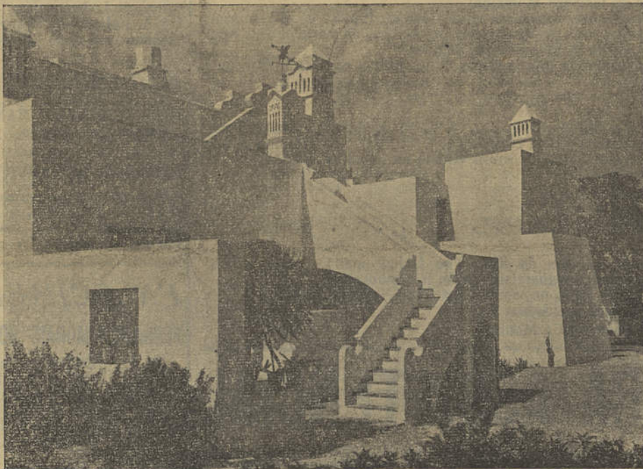
UM ASPECTO TÍPICO DA ARQUITECTURA ALGARVIA

Este posto denominado C. U. X. 7, que há muito se impunha, pela absoluta necessidade de contactar com a nossa frota de pesca, trabalha na frequência dos 1.667 K/W e tem uma potência de 45 a 50 W, tendo empregados 4 rádio-telegrafistas, em permanente serviço de escuta e informações.