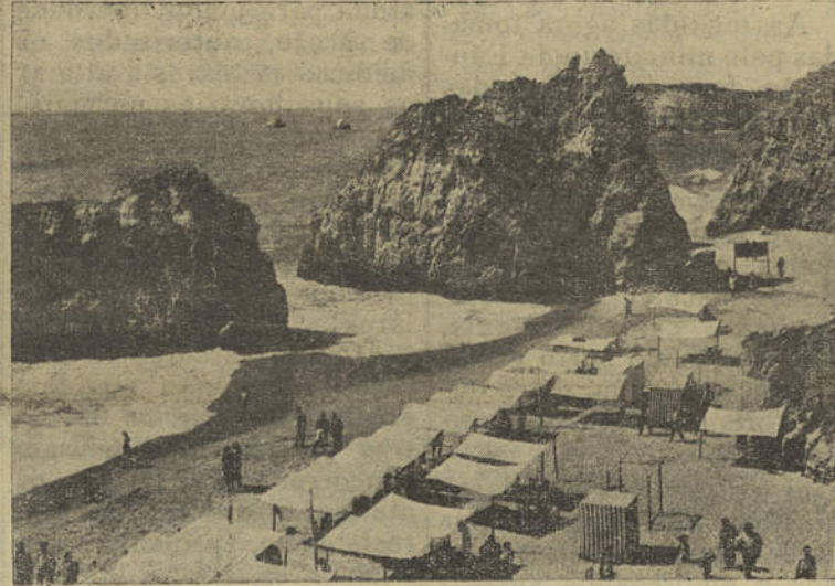
PRAIA DA ROCHA