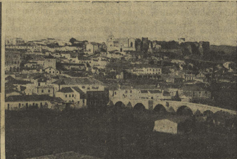
Vista parcial da cidade de Silves