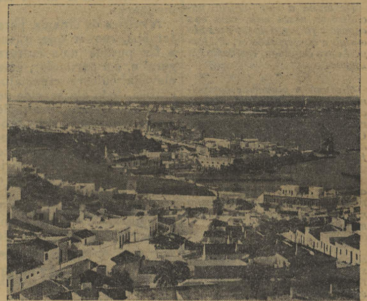
Vista Parcial de Aiamonte