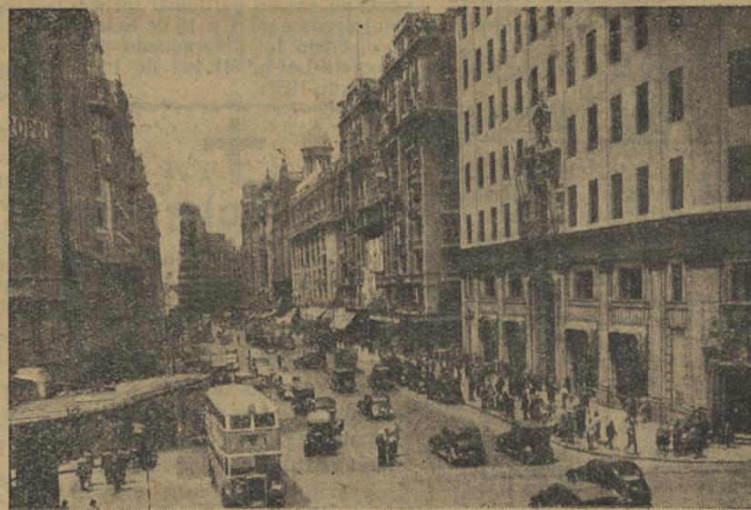
MADRID — A célebre «Gran Vía»

Desde o comércio, sempre feito em bases que seguramente incitam à compra, passando pelo artesanato, que tem um extraordiná-