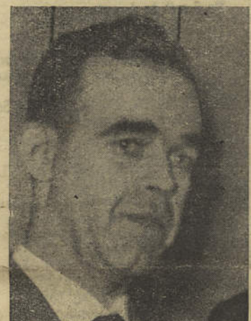
Ministro Arantes e Oliveira

dia deixar de ser, é-nos grato registar nestas colunas a boa vontade da edilidade pombalina, formulando votos para que esses bons propósitos colham os frutos que todos nós almejamos.