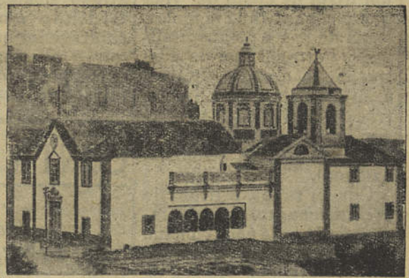
Igreja de N.ª S.ª dos Mártires

ção das autoridades eclesiásticas, é o seguinte: