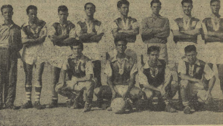
GRUPO DESPORTIVO «O CELEIRO»

Trata-se de um Clube de modestos recursos, que muito tem lutado pela sua existência, a qual já conta largos anos, coincidindo