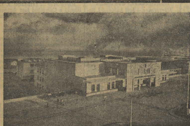
Edifícios do Matadouro-Frigorífico da Câmara Municipal de Lisboa — nos Olivais

Sobre a Ribeirinha, tenho na minha frente uma novela de mentiras de Rebelo da Silva, (O'dio Velho não Cansa) que faz dela uma mulher infernal, de seu irmão o pior dos miseráveis e do seu raptor um mártir!