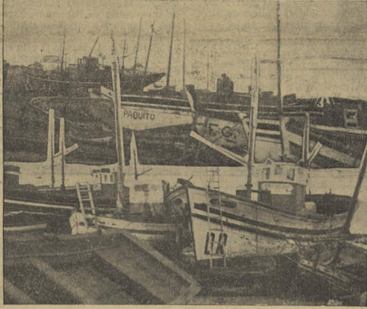
Um aspecto dos estaleiros desta vila

O estabelecimento da indústria da construção naval na nossa terra data dos primeiros tempos da fundação da vila, tendo sempre desempenhado, com maior ou menor relevo, um papel importante na economia local. Embora tenha atravessado, por diversas vezes, períodos graves de crise, como natural consequência das faltas de pesca que periodicamente se observam, nunca paralisou a sua actividade, nem — facto que importa sobretudo acentuar — deixou de melhorar, progressivamente, o seu nível técnico. Dos antigos «calafates de ribeira» aos actuais construtores, a fama dos técnicos de construção naval de Vila Real de Santo António, foi sempre merecedora de justos encómios, e as unidades que todos os anos saem dos nossos estaleiros, desde o vulgar bote às traineiras e outras embarcações de maior tonelagem, constituem os melhores testemunhos do seu excelente trabalho. cremos, mesmo, que, com um pouco mais de iniciativa, a sua situação poderia ser muitíssimo superior àquela de que disfruta presentemente. Depois de alguns anos de declínio, com uma acti-