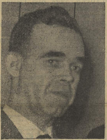
Eng. Arantes e Oliveira