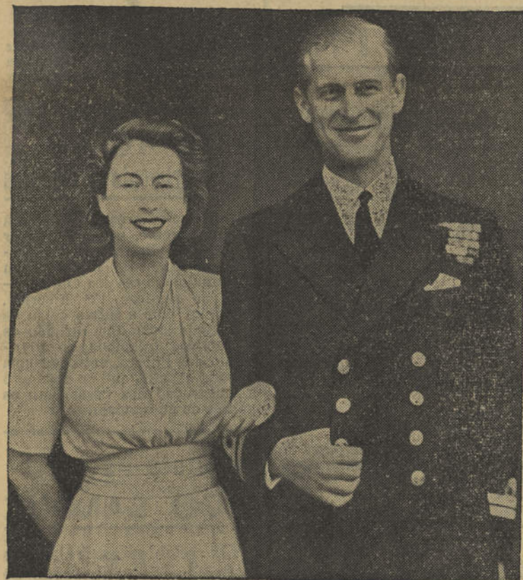
S. M. Isabel II de Inglaterra e seu augusto esposo, o duque de Edimburgo

ENTRA amanhã em Lisboa a Rainha Isabel II de Inglaterra, em visita oficial ao nosso País: —entra no Terreiro do Paço, onde, em tribuna especial, a recebem o Chefe do Estado, o Governo e outras entidades de categoria política, entre as quais o Corpo Diplomático. Pisa, pela primeira vez, a Soberana da nossa velha Aliada, terras de Portugal, ao desembarcar no Cais das Colunas do Terreiro do Paço — formoso vestíbulo de Lisboa e do País.