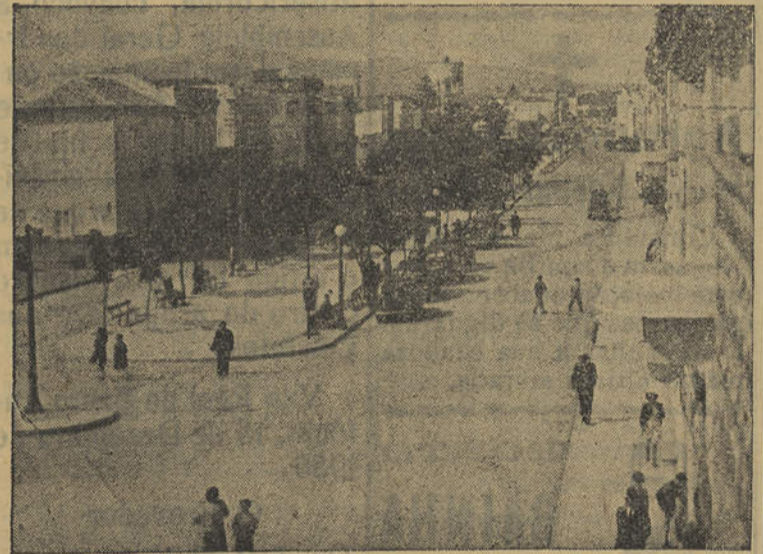
OLHÃO — Avenida da República

A artista recebeu, no final, os mais vivos aplausos pelo valor e interesse dos seus trabalhos. São 65 grandes e pequenas telas, em que a pintora, firme na sua maneira de interpretar a natureza, nos dá emotivos aspectos não só do seu Algarve e de quase todas as restantes províncias do País, mas também da vizinha Galiza. «Panorama» — Mondariz, «Rio Têa», «Piteiras» — Faro, «Ria de Faro» e «Ameias do Casal de Penhalva» — São Pedro de Sintra, são telas que mereceram vivos aplausos à autora. A exposição continua patente ao público até ao próximo dia 17.