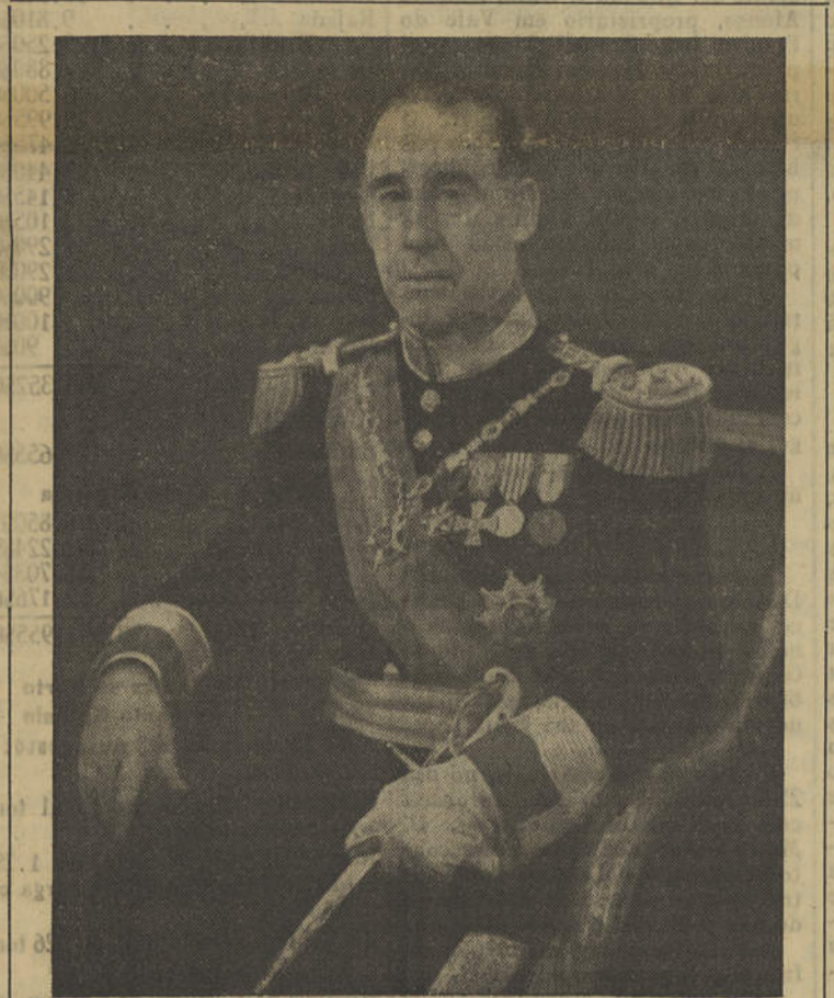
GENERAL CRAVEIRO LOPES

A VIAGEM que no passado dia 2 o sr. general Craveiro Lopes iniciou a nossa provincia ultramarina de Moçambique marca, com o seu superior significado politico, uma etapa de transcendente importância no plano nacional, com repercussões do maior relevo no âmbito das nossas relações com as potências vizinhas daquela parcela de Portugal em Africa — a União Sul-Africana e a Federação das Rodésias e Niassalândia — que o Chefe do Estado português também visita, a convite, altamente honroso, dos respectivos Governos. No plano nacional, esta visita é a resultante de uma necessidade de íntimo contacto entre os governantes e as populações de todas as parcelas do Império Português, disseminado pelo mundo, como melhor meio