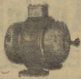
Motor de c. c.