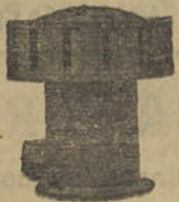
Sereias para todos os fins

Construção, transformação e reparação de máquinas eléctricas e seus acessórios, instalações de baixa e alta tensão e em navios