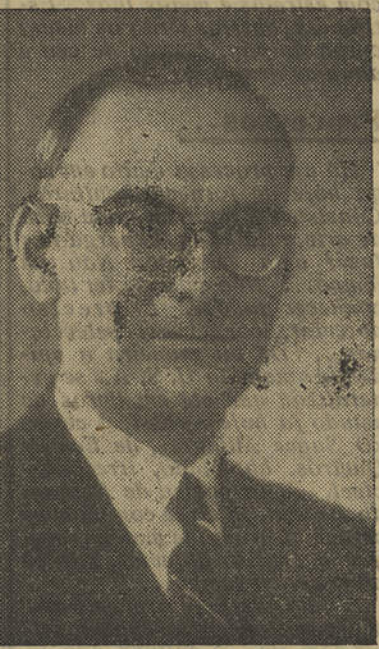
Prof. Dr. Marcelo Caetano

Praia, onde realizou uma relevante obra de valorização, e o presidente da Junta de Freguesia local. Para festejar o importante melhoramento, foi distribuído um bardo a 100 pobres, efectuando-se, à noite, na Esplanada Oceânica, uma interessante festa, com concerto por uma orquestra de Loulé, em que se queimou vistoso fogo de artifício.