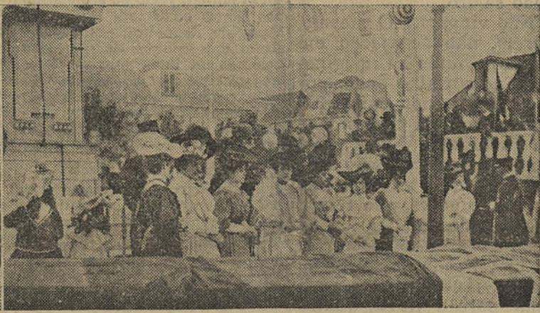
Dois aspectos da distribuição do bodo aos pobres, na Praça Marquês Pombal, na tarde de 14 de Abril de 1906