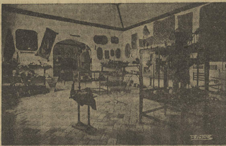
Museu de Lagos — Sala Regional

Olhão, neste caso, teve mais sorte do que nós. E' tanta sorte que até tem casas a mais. Veremos se agora, com a publicação do decreto de há dias, pela pasta das Corporações, sobre Habitações Económicas, teremos mais sorte. E' havemos de concordar que já não é sem tempo!