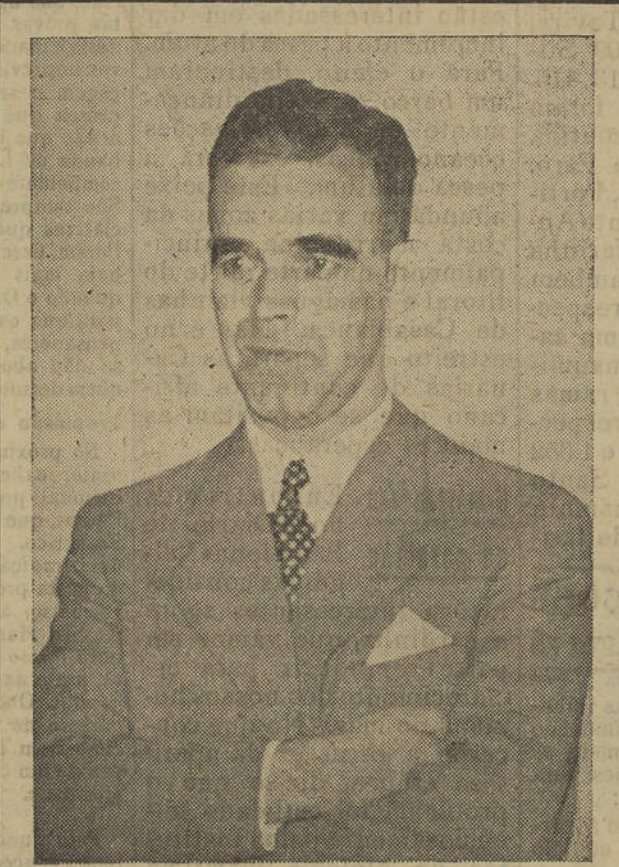
Eng. Eduardo de Arantes e Oliveira, ilustre ministro das Obras Públicas