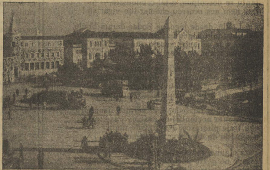
FARO — Um lindo aspecto da capital algarvia