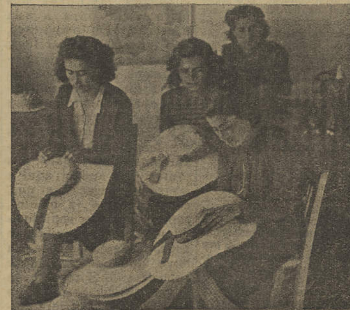
Rapatigas de Loulé confeccionando os vistosos chapéus, de empreita que os banhistas tanto apreciam

Vale a pena assistir ao que se passa no Barreiro, quando se pretende tomar comboios para as plagas a sul do Tejo, e ficar-se-á edificado sobre o carinho especial que a C. P. merecem os passageiros desta metade sul do País. Porquê?!