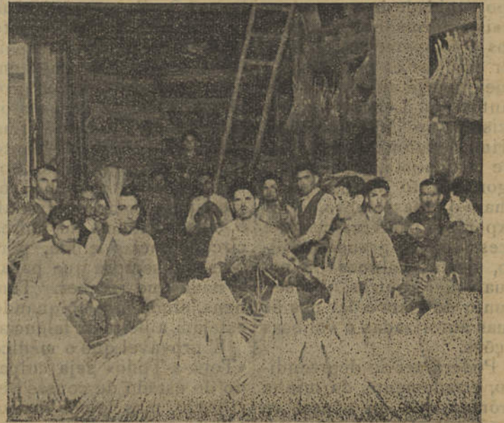
Trabalhadores do concelho de Loulé confeccionando vassouras de palma

Simplemente, os críticos abrem fronteiras na arte e na literatura. Certas ideias sedimentadas pelos anos, homologadas e aceites por gerações sucessivas, participando