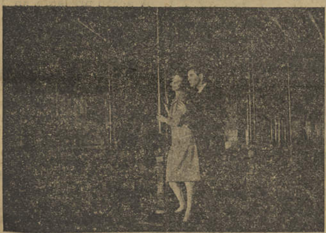
Depois de Achtung Banditti!, Cronache di Poveri Amanti, é a obra-prima de Lizzani e uma das mais importantes do cinema neo-realista italiano. De Carlo Lizzani apenas se conhece em Portugal A Margem da Metrópole (distribuído pela Sonoro Filme), e o livro «Le Cinéma Italien» (à venda na Livraria Bucholtz). E' um dos grandes nomes do cinema de hoje.