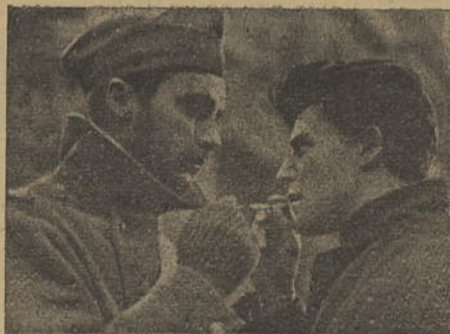
Le diable au corps (1946), com Gérard Philipe e Micheline Presle, é a obra-prima de Autant Lara e um dos mais importantes filmes do cinema contemporâneo. Os filmes de Autant Lara, incluindo o recente Le bleu en herbe, são desconhecidos em Portugal, com excepção de Sílvia e o Fantasma e Coração Impaciente.

Sob esta rubrica, vamos passar a publicar, semanalmente, imagens de filmes inéditos em Portugal e cuja importância na história do cinema é assinalada lá fora como fundamental.