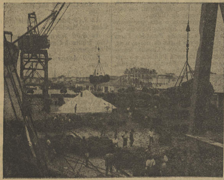
Cais Comercial de Vila Real de Santo António