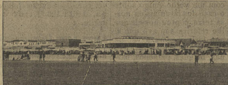
MONTE GORDO — Aspecto da praia

O «Notícias do Algarve» apresenta ao sr. almirante Guerreiro de Brito cordiais cumprimentos de felicitações.