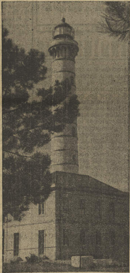
Faro de Vila Real de Santo António, situado na mata de pinheiros que se estende até Monte Gordo

JÁ aqui tentámos mostrar a necessidade da senhora Comissão Municipal de Turismo agir no sentido de se apetrechar devidamente e decorosamente uma zona da nossa mata a parque de campismo. Não sabemos em que grau de consideração foi tomada a nossa lembrança, mas tendo em conta que a dita Comissão é constituída por individualidades de notória capacidade e de ideias bem arejadas, não nos repugna admitir que a sugestão foi devidamente pesada, já que, ao fazê-la, pensámos na valorização e na dignidade turística da nossa terra, com as concomitantes repercussões na dignidade turística do Algarve. Não voltaríamos a insistir neste por menor turístico, se as circunstâncias não lhe dessem uma actualidade flagrante, e não curaríamos sequer de saber se a nossa ideia fora pesada na balança do desleixo ou na outra mais equilibrada que Roberval ofereceu à desonestidade dos merceari-