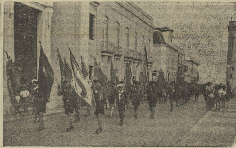
Os Escuteiros de Lisboa, à sua chegada a Vila Real de Santo António, desfilam com destino ao acampamento