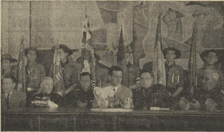
A Mesa que presidiu à Sessão Solene comemorativa do 30.º Aniversário do Grupo n.º 60