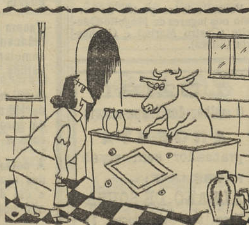
— É verdade, D. Pepa, resolvi acabar com os intermediários. Ora, então, quantos litros de leite quer?...