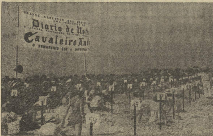
Aspecto de um dos últimos «Concurso das Praias», realizado em Monte Gordo

Dos festejos, constam as habituais solenidades religiosas — Missa solene e procissão — e as diversões do costume, tais como: concerto musical, corridas, fogos de artifício, etc., que ali costumam atrair inúmeros forasteiros, sendo de esperar este ano maior afluência, em virtude das muitas excursões que têm visitado esta região.