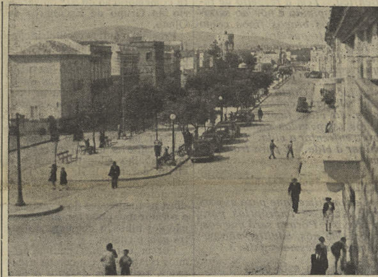
Um aspecto de Olhão

No entanto, a Justiça corre o Mundo fora e vai deixando por onde passa sulcos profundos de dor, agonia, desgraça e tirania. A pobre deusa nem sempre verga