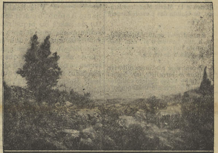
CALDAS DE MONCHIQUE — Terras da Francesa