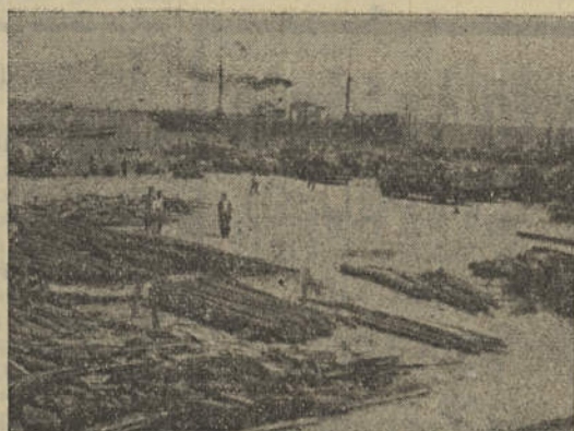
Em segundo plano, o cais da nossa lota coalhado de barcos, em dia de abundância de biqueirão.