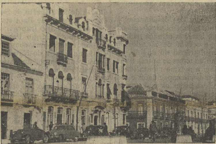
Um aspecto da Avenida da República, vendo-se, em primeiro plano, o esplêndido edifício do Hotel Guadiana.

As exigências actuais obrigam a modernizar as antiquadas instalações para atrair e conservar os hóspedes, que, se não vêm em número mais avultado, é precisamente porque não encontram as comodidades que exigem. Modernizado, o hotel dará um rendimento muito apreciável e constituirá nova valorização para o turismo do Algarve — X.