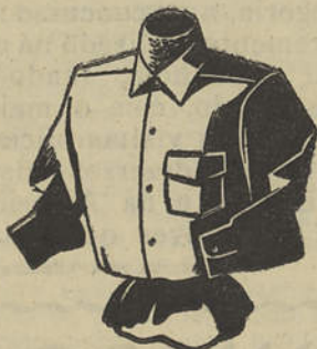
Confecções Viresa, L. da FÁBRICA DE CAMISAS VILA REAL DE SANTO ANTÓNIO

Quanto a vir dizer-nos que em Portugal se está obrigado a acatar as leis francesas, e que a «Summa Theológica», de S. Tomás de Aquino, é um tratado de Astrologia, não é a mim que compete desfazer tais distates, e sim, respectivamente, aos juristas portugueses e à hierarquia da Igreja.»