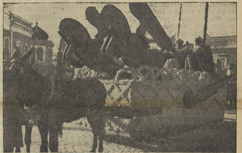
Um aspecto do carnaval em Loulé

Tanto os prosadores como os poetas portugueses acompanharam de perto os mestres franceses. Mas três dos nossos escritores inclinaram-se abertamente para os naturalistas ingleses, cuja maneira de sentir e pensar revelava um poder de expressão mais calmo, mais sereno e mais britânico.