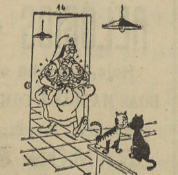
UM GATO (para o outro) — Achas que ela vai afogar alguns?