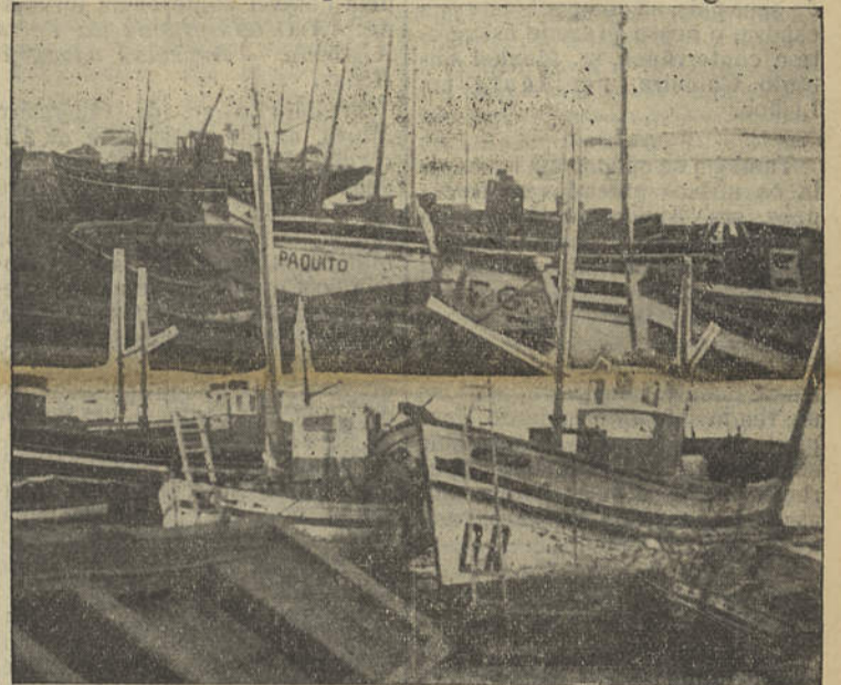
Aproveitando o defeso, a nossa frota de pesca submete-se à clínica dos estaleiros, onde vai agora grande azáfama.

Para atender ao excesso de matriculas, o Subsecretário de Estado da Educação Nacional criou mais 57 escolas e 51 postos escolares, em diversos distritos do País.