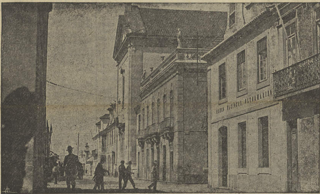
Vila Real de Santo António — Rua Teófilo Braga