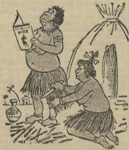
A MODA DAS SAIAS CURTAS NA SELVA...

Saudando este novo colega e todos os que nele trabalham, desejamos-lhe, sinceramente, longa vida.