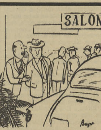
OS GRANDES SEGREDOS DA INDÚSTRIA: — Confidencialmente: Parece que o «Citroën» do ano que vem traz um novo modelo de cinzeiro.