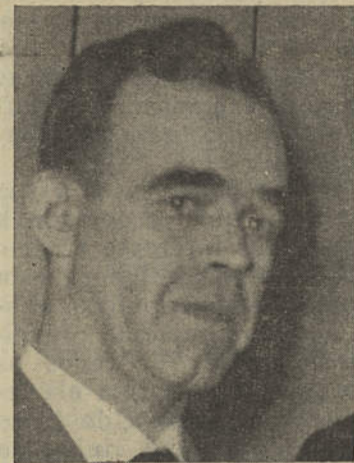
Eng. Arantes e Oliveira

O sr. eng. Arantes e Oliveira, que é acompanhado por directores gerais do seu mi-